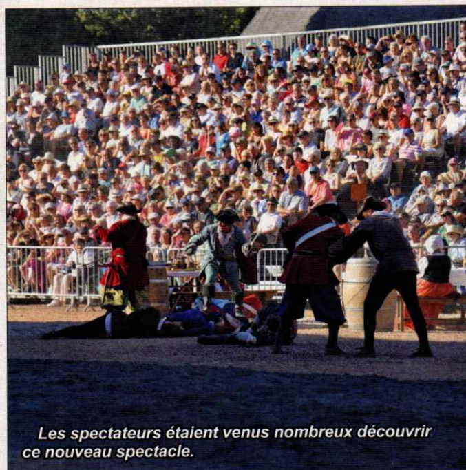
Les spectateurs étaient venus nombreux découvrir ce nouveau spectacle.