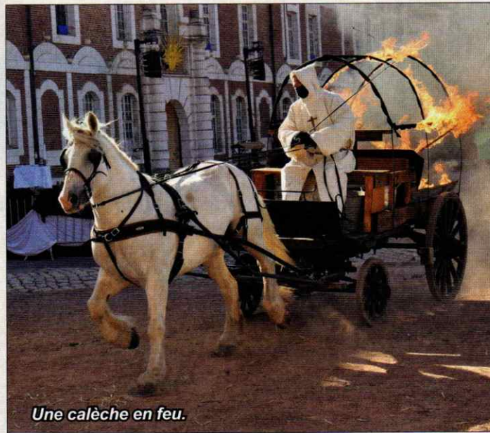
Une calèche en feu.