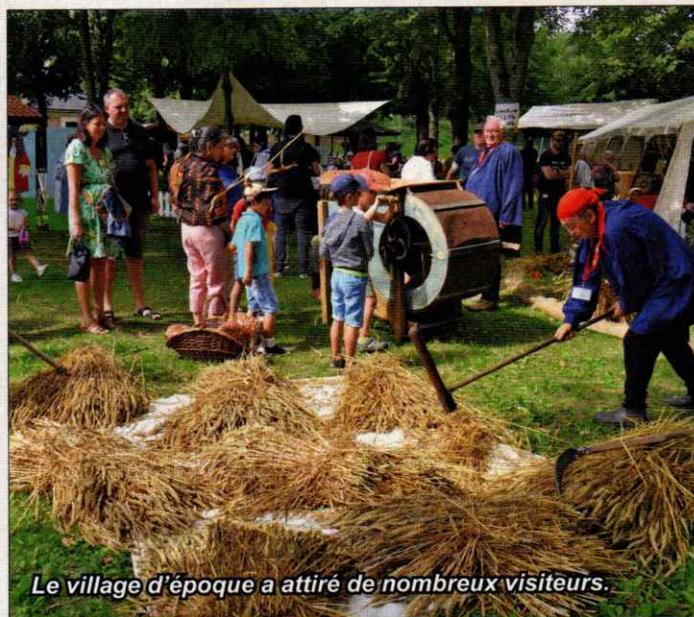
Le village d'époque a attiré de nombreux visiteurs.