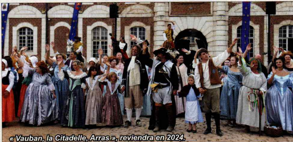
« Vauban, la Citadelle, Arras », reviendra en 2024.

« Vauban, la Citadelle, Arras », le tout nouveau spectacle vivant de l'association Artois Culture Nature a été dévoilé les 18, 19 et 20 août lors de 8 représentations, qui ont rassemblé 9 600 spectateurs. Au delà du spectacle, le village d'époque recomposé au cœur de la citadelle d'Arras a attiré de nombreux visiteurs et curieux. Un franc succès pour la 1 ère édition de cet événement qui promet d'être reconduit en 2024, malgré les Jeux Olympiques qui se dérouleront en France au même moment.